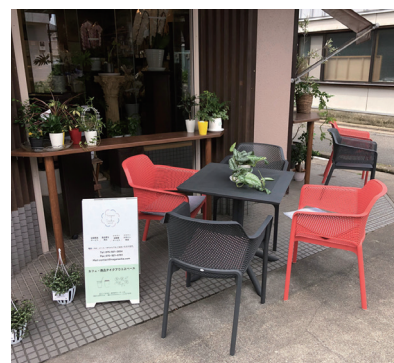
憩いの場となったカフェスペース