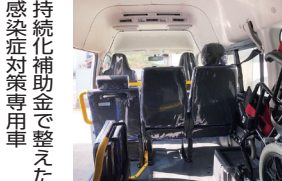
持続化補助金で整えた 感染症対策専用車