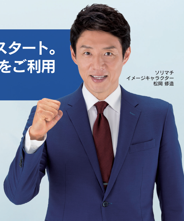
ソリマチ イメージキャラクター 松岡 修造