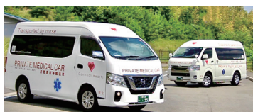
自社所有の民間救急車