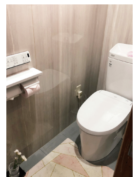
新しくなった洋式トイレ