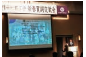
賀詞交歓会SSCプレゼン