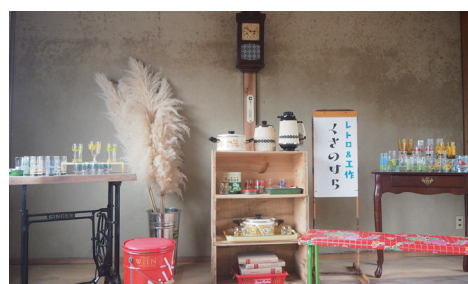
店内では古物販売も行う

また、補助金で導入したポータブル電源を活用することで、屋外イベントでもレーザー加工が可能になりました。お子様の描いた絵を木材にその場で彫刻し、自分だけのmyお土産物として持ち帰れるワークショップも開催できるようになりました。