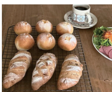
レッスンで調理したパン

まいります。初めての方向けにお試しレッスンも開催しておりますので、ぜひお気軽にお問い合わせください。