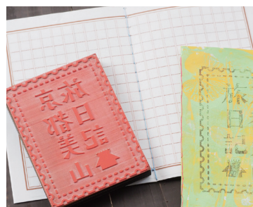
レーザーで制作したオリジナルハンコ