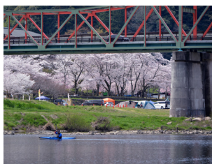
笠置のやさしい春

四季折々の魅力があふれる笠置町では、春の「さくらまつり」、夏の「灯ろう流し」、秋の「もみじまつり」、そして冬の「全国ご当地鍋フェスタ」と一年を通して多彩なイベントを開催しています。木津川の清流沿いでは、キャンプやカヌーなど自然を満喫できるアクティビティも充実しています。雄大な自然と心温まる人々が迎えてくれる笠置町で、季節ごとの体験をお楽しみください。