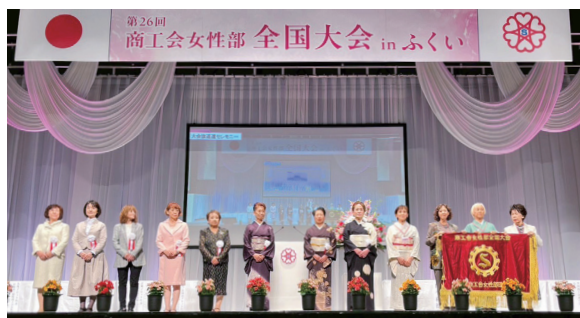
大会旗返還セレモニーの様子

10月15日（水）～16日（木）サンドーム福井メインホールにて、全国各地より約2,000名以上の参加のもと第26回商工会女性部全国大会 in ふくいが盛大に開催されました。