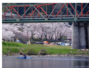
笠置のやさしい春

四季折々の魅力があふれる笠置町では、春の「さくらまつり」、夏の「灯ろう流し」、秋の「もみじまつり」、そして冬の「全国ご当地鍋フェスタ」と一年を通して多彩なイベントを開催しています。木津川の清流沿いでは、キャンプやカヌーなど自然を満喫できるアクティビティも充実しています。雄大な自然と心温まる人々が迎えてくれる笠置町で、季節ごとの体験をお楽しみください。