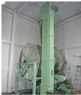
宇治田原町商工会 茶製造小売業 (株)西出製茶場

緑茶(リーフ茶)市場において、国内市場は縮小傾向も、海外市場においては輸出増加傾向にあります。弊社においても海外向け製品製造設備の導入を検討するにあたり、商工会から提案のあった「京都企業設備投資支援事業補助金」を申請。同補助金の採択を受けて新たな設備投資を実施しました。これにより、顧客からの要求品質への対応や、処理能力向上等によるコスト削減を実現する事ができました。弊社も含めた中小企業では、「ヒト・モノ・カネ」の経営資源が不足しています。今回、京都府及び商工会から受けた一連の支援では、不足している経営資源の補充と、新たな市場開拓に有効な支援をいただけたものと思っています。