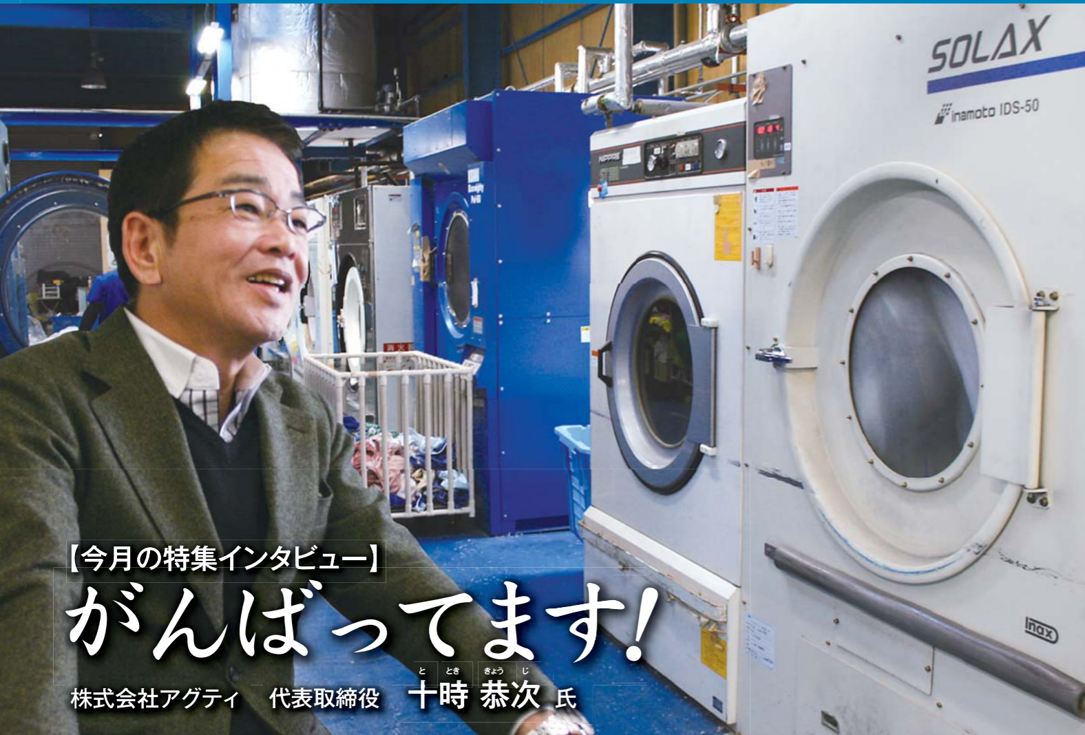
【今の特集インタビュー】