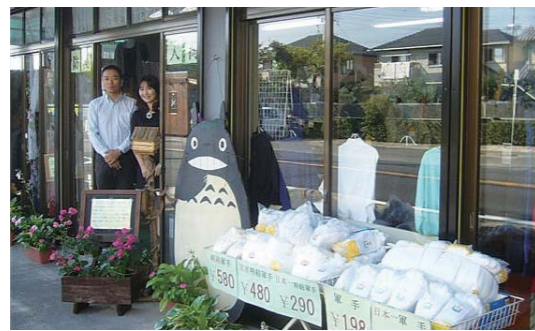
木津川市木津町商工会 衣料品販売業 (株)ワーキングショップ三徳