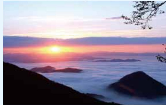
鬼嶽(おにたけ)稲荷から望む雲海