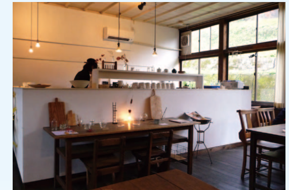
旧田山小学校の教室を利用したカフェ「ねこぼん」