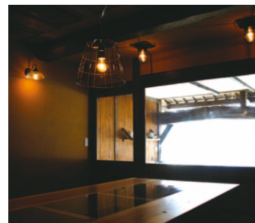
船の格納庫だった1階はリビングに

骨組みを残しほとんど改装したという舟屋は、伝統的な外観に対し、中身は現代風のしつらえである。船