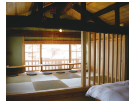
ベッドルームの奥に海の間がある

舟屋の宿まるいちに宿泊するならば、釣り船「まるいち丸」での釣り体験もお奨めしたい。出船は午前9時と午後の部1日2便。手ぶらで乗船できる魚釣り体験(3時間5,000円)や、エギング(アオリイカ釣り)4時間5,000円など、初心者向けのコースがあるのが特徴だ。「普通は魚が釣れるポイントまでは30分、時間とかかるものですが、伊根湾は外海に出なくても穏やかな湾内で様々な海の幸に出会える。近場だった穴場のスポットまで10分ほど。燃料代も抑えられますので、手頃な時間と価格での体験メニューをご提案できるといった。着想の原点を話してくれた。