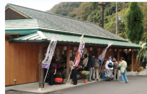
南山城村農林産物直売所

南山城村は京都府の最南東に位置し、北は滋賀県、南は奈良県、東は三重県に接しています。村の中央には国道163号線・JR関西本線が通り、木津川が添うように流れています。