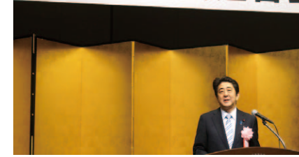
安倍首相あいさつ