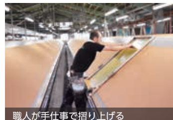
職人が手仕事で摺り上げる

用の仕方を相談する他、京都府が主宰する経営者のためのセミナーを紹介していただいたり、