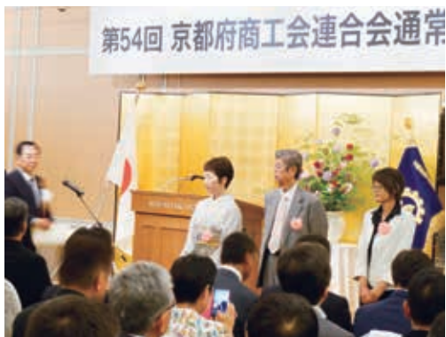
第54回 京都府商工会連合会通常

一方、経営資源に乏しい小規模事業者等では、これらイノベーションへの取組み及び計画達成までの様々な障壁に直面することが多く、途中で断念しているケースも散見されます。積極的にチャレンジするものの、障壁に立ち止まる企業を新たな事業