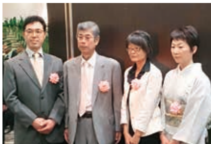
(左から) パール染色(株)様、日産スチール工業(株)様、日本アート印刷(株)様、三景印刷(株)様